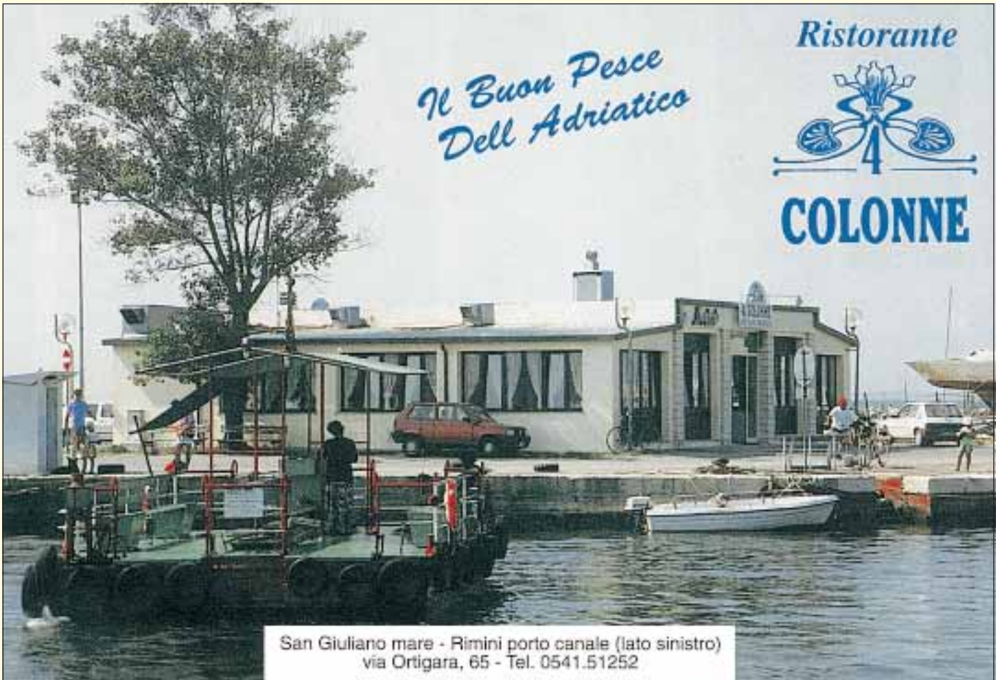
San Giuliano mare - Rimini porto canale (lato sinistro) via Ortigara, 65 - Tel. 0541.51252