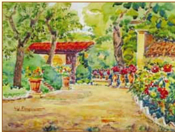
La tettoia e i fiori (Vergiano), acquerello, collezione privata.

quali copertine ed illustrazioni di "La Piè", "Ariminum" ed alcune riviste balneari. A queste incisioni di grandi dimensioni si affiancano gli ex libris, le cartoline pubblicitarie e gli annunci di nascita e di matrimonio. Numerose le xilografie dedicate a San Marino, compiute durante la sua residenza nella Repubblica per svolgere