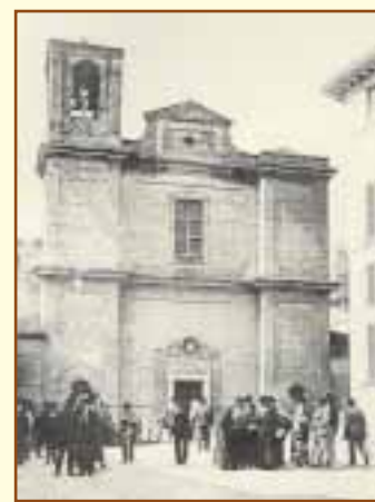
Chiesa della Collegiata nei primi anni del 900. Sul campanile manca ancora la cuspide che sarà realizzata nel 1937. (Coll. Marchi).

conto chiarificatore del Garampi. C'è infine da notare un'ultima epigrafe posta nel transetto sopra l'entrata della cappella, incisa su marmo rosso simile a quella dell'arca e molto probabilmente si tratta del suo schienale, che degnamente ricorda l'opera benemerita del conte Antonio Baldini che a proprie spese aveva provveduto alla costruzione della cappella: ANTONIVS IOSEPHI F BALDINIVS COMES ADLECTVS IN / SPLENDIDISS ORDINES VRBINATIVM ARIMINEM ET REIPVBL / SAMMARINEN AEDICVLAM AERE PROPRIO FVNDATAM BONIS / LOCVPLETATAM PRIVILEGIIS MVLTIS A PIO VII P M