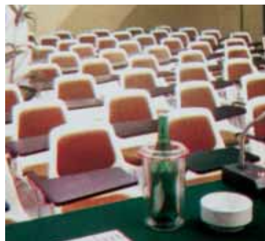
SALA CONGRESSI 50-120 POSTI

http://www.iper.net/ariminvn E-mail: ariminvn@iper.net