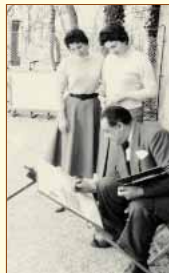
Pasquini dipinge la casa Pascoli a San Mauro, 1955, Archivio fotografico della Biblioteca Gambalunga.

cromie. Anche le piccole piazze ed i vicoli del nativo Borgo San Giuliano e soprattutto il porto, con il faro e le scomparse bilance da pesca sono i protagonisti delle sue vedute, che mostrano zone suggestive anche di altre località, spesso luoghi in cui l'artista ha lavorato, come la Repubblica di San Marino e Spoleto.