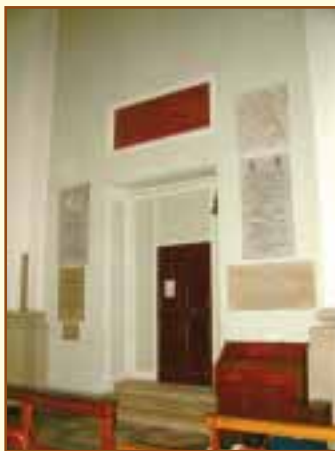
Il probabile schienale dell'arca sopra l'entrata della cappella nel transetto della chiesa.

tere in onore l'antico sarcofago. Anche se l'arca non aveva alcun rapporto col culto del Beato Simone, la cassa di marmo rosso... per curioso capriccio del possessore fu trasportata in Santarcangelo... si limita a dire il Tonini, l'idea di Baldini fu quella di aumentare il decoro della cappella con un prezioso monumento al quale la Beata Chiara aveva aggiunto un ricordo di santa venerazione; inoltre al conte, se non altro, si deve il merito di averla salvata dalla terribile devastazione del patrimonio artistico e culturale avvenuta in quegli anni di rivoluzione.