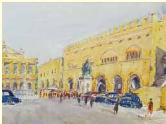
Piazza Cavour, acquerello, anni '60, collezione privata.

La natia Rimini è stato uno dei temi importanti della sua pittura. Non c'è angolo della città che non sia stato immortalato varie volte dal Pasquini nel corso della sessantennale attività. Non solo le principali piazze ed i suoi monumenti più noti rivivono con meticolosa verità nei suoi grandi fogli acquerellati, composti da rapidi tocchi dalle brillanti