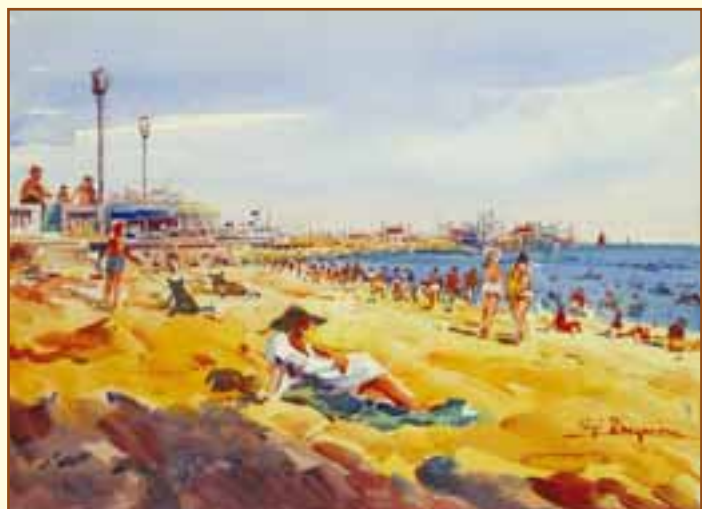
Bagnanti a Rimini, acquerello, 1969 circa, collezione privata.