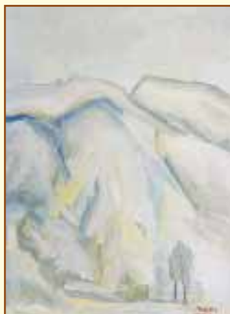
Mirro, Paesaggio , 1976 (olio su tela) cm. 30x40

Campionarie a Milano, le riunioni in pista al Vigorelli...) e cominciava a raccontare... Lo so per esperienza diretta: i poveri, che hanno avuto poche occasioni di viaggiare, che del mondo hanno visto soltanto ciò che c'è oltre la porta di casa, sanno essere dei raccontieri insuperabili. La concezione narrativa di Mirro lasciava poco spazio all'infimo piacere della identificazione, all'ottusa virtù della verità. Come per tutti i grandi affabulatori, anche per Mirro, la materia prima dell'arte narrativa era la fantasia. Aveva scritto Vladimir Nabokov: “Definire una storia una storia vera è un insulto all'arte e alla verità. Ogni grande scrittore è un grande imbrogliatore”. Ho sempre saputo che la ricerca di una vita reale, di persone reali