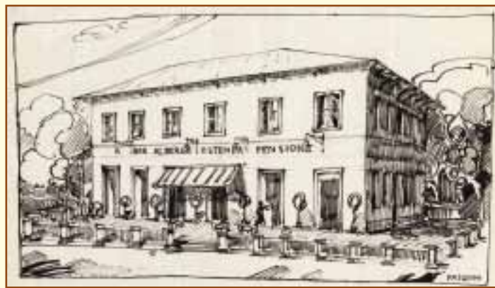
Bar Albergo Ostenda, china su carta, 1927, Biblioteca Gambalunga.