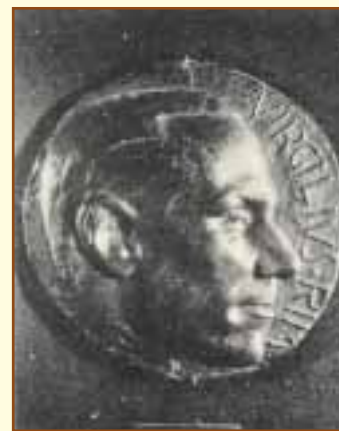
Ritratto di Virgilio Ricciotti. Medaglione in bronzo modellato nel 1937 da Elio Morri.

Sopravvenne la Grande Guerra, alla quale egli non avrebbe potuto partecipare a causa della sua imperfezione fisica. Ma Virgilio non restò a casa. Riuscì, avvolto in una